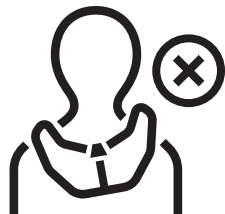
18. Hövding met een onjuiste en te grote pasvorm rond de nek.