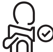
19. Hövding correct geplaatst met een kap. Hövding moet altijd boven de kap worden geplaatst.