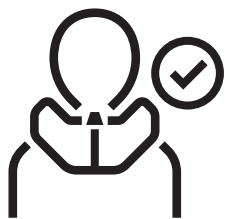
17. Hövding med en korrekt tight passform direkt mot halsen.