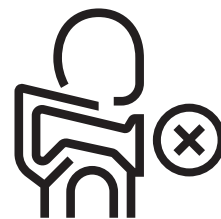
20. Hövding inkorrekt placerad tillsammans med huva. Hövding ska aldrig placeras inuti huvan och huvan får aldrig täcka spricksömmarna på Hövding (2).