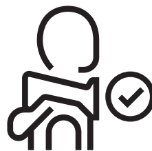
19. Hövding korrekt placerad tillsammans med huva. Hövding ska alltid placeras ovanpå huvan.